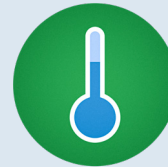
starke Temperatur- schwankungen