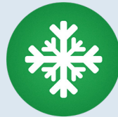
Schnee oder Frost