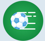
Schläge, Stöße oder Abrieb