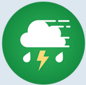
Schlagregen, Hagel oder Sturm